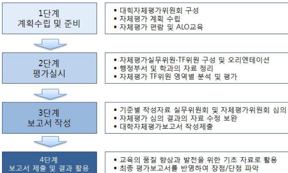
[그림 1-2] 대학자체평가 절차

대학자체평가는 계획수립 및 준비, 평가 실시, 보고서 작성, 보고서 제출 및 결과 활용의 절차로 체계적으로 진행하였다.