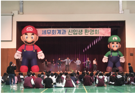
신입생환영회 및 오리엔테이션 입학 시작과 적응과 교우관계를 위한 다양한 행사