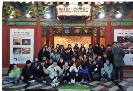
다양한 체험 활동 경험의 폭을 넓히고 학과의 유대를 위한 문화활동 등 개최