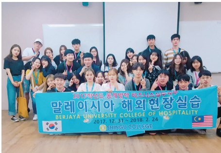
국내외 현장실습 세무서 및 기업체 현장실습은 물론 영어권 해외현장실습 진행