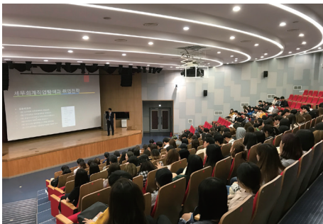
다양한 진로 특강 현업에 종사 중인 전문가 및 선배 등을 초청하여 진로개발을 위한 특강 개최