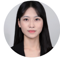
여 은 재 동문