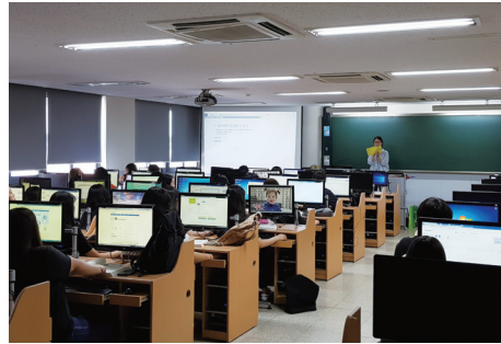
전공자격증 특강 방학 중 취업에 필요한 자격증에 대한 무료특강을 진행